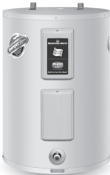
Photo du M-1-20L6DS